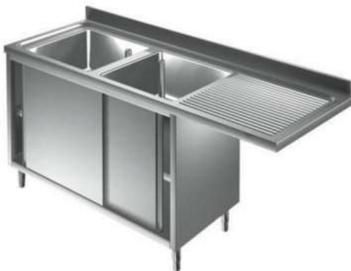
Tavolina kuzhine profesionale INOX