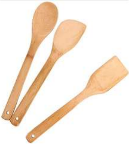
Set lugë druri